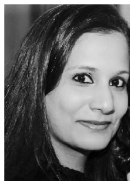
CHEETAL SUNT CHAIR COMMUNITY SERVICE