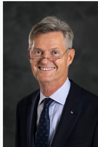
President Rotary International 2020-21 Holger KNAACK

The year 2020 has brought monumental changes that have already included a global pandemic and a renewed call for social justice. We are reminded that we live in a constantly changing world, and Rotary is a reflection of that world.