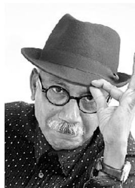
VINO SOOKLOLL CHAIR STRATEGY DO PUBLIC IMAGE ARPIC ZONE 22 ADVISOR RI/CC